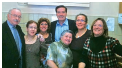
Au traditionnel couscous de décembre avec Femmes, Culture, Solidarité, Partage dans le 9 e .