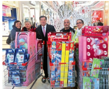
Achats de cadeaux de Noël pour les Restos du cœur du 2 nd et du 4 e , avec les bénévoles.