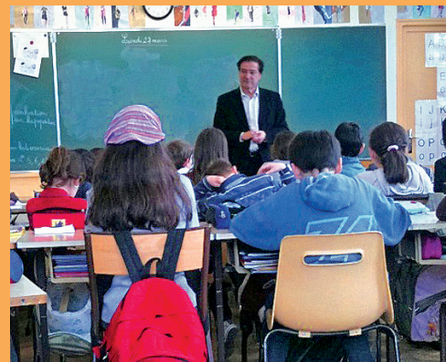
A l'école La Fontaine (4 e ), qui a participé au Parlement des Enfants en 2010.

A plusieurs reprises, j'ai eu le plaisir d'aller à la rencontre d'élèves de primaire et secondaire pour présenter ma fonction de parlementaire, et d'accueillir des élèves à l'Assemblée Nationale. •