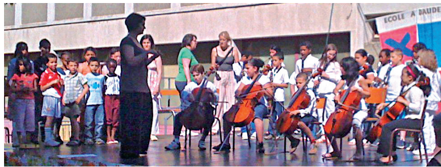
Les enfants de l'école de musique de Saint-Rambert.